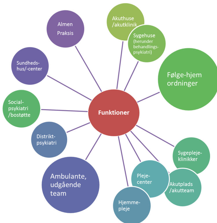
Figur 1: Funktioner i det samarbejdende sundhedsvæsen

De forskellige arbejdspladstyper og funktioner fremgår af figur 1, og de bliver efterfølgende kort beskrevet. Derefter sættes fokus på to funktioner, som referencegruppen har prioriteret, hhv. "Ambulante, udgående team fra sygehuse" og "Følge-hjem ordninger" i regionalt regi.